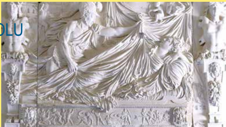
34 Le pardon du Christ.