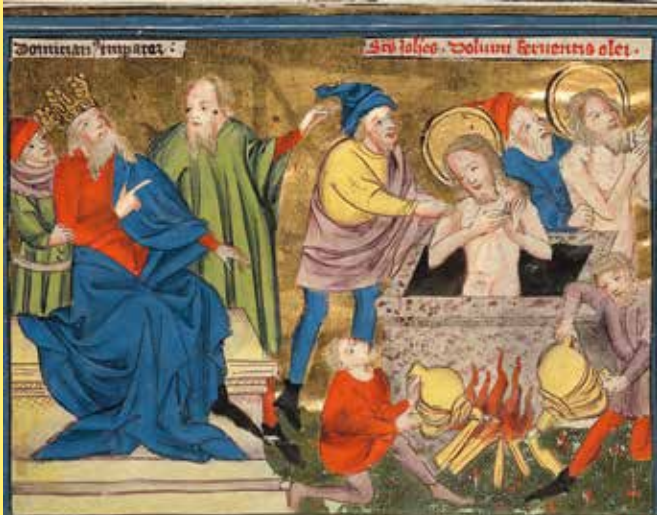
57 Et le monde aura une fin. L'Apocalypse aux Éditions Moleiro