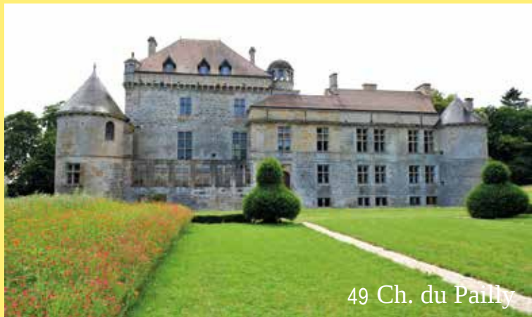
49 Ch. du Pailly