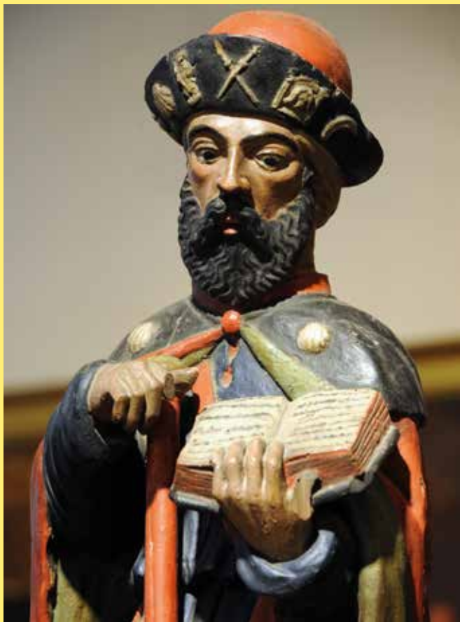
67 Les « Chemins de Compostelle en France » ont 20 ans