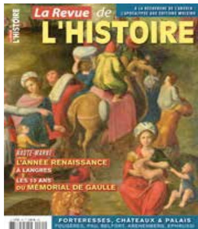
Traversée de la Mer Rouge, vers 1580, huile sur toile, dépôt de l'hôpital de Langres (détail)

Notre civilisation moderne avance très vite et tâtonne sur les sentiers de l'Apocalypse, du troisième âge et du troisième homme. Notre culture suit le même chemin. Elle va de toutes parts. Elle sait qu'elle se modifie. Le transhumanisme est conjoint à la mondialisation des esprits, tandis que le monde intellectuel cherche toujours à comprendre où seront les grands équilibres du futur.