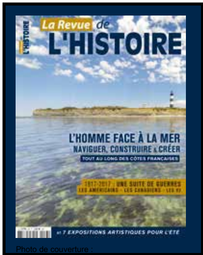
Photo de couverture

L'île d'Oléron