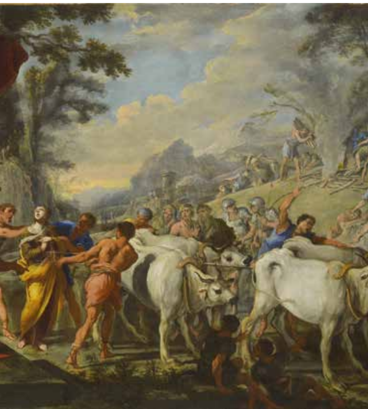
Le martyre de Sainte Lucie de Domenico GARGIULIO

17 La Devinière, Indre-et-Loire. L'annonce de la vérité par deux auteurs de la Renaissance : Rabelais / Nostradamus