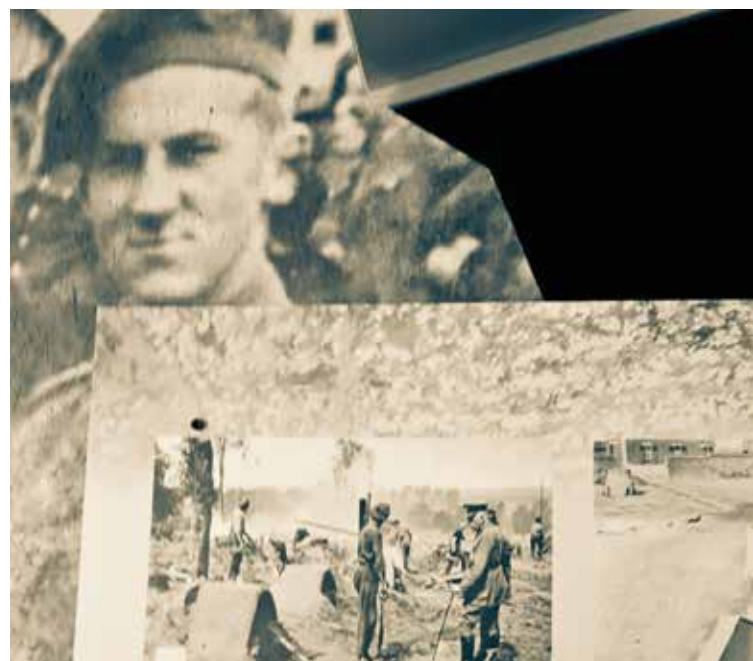
Les Canadiens. Vimy, Pas-de-Calais

54 Le Havre. Exposition pour le 500 ee anniversaire. L'amiral de Graville, un grand seigneur recherchait la beauté