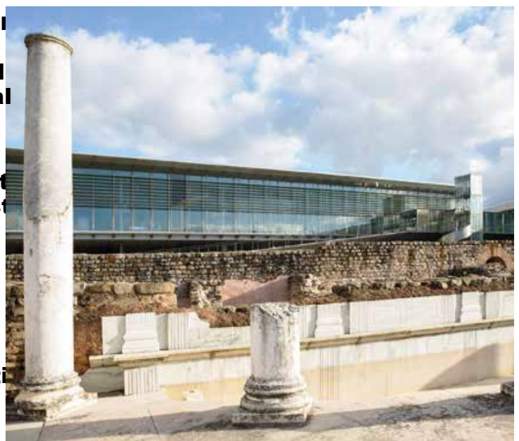
Musée de Saint-Romain-en-Gal

49 Le complexe monumental anti- de La Genette (Lyon, Saône-et-Loire)