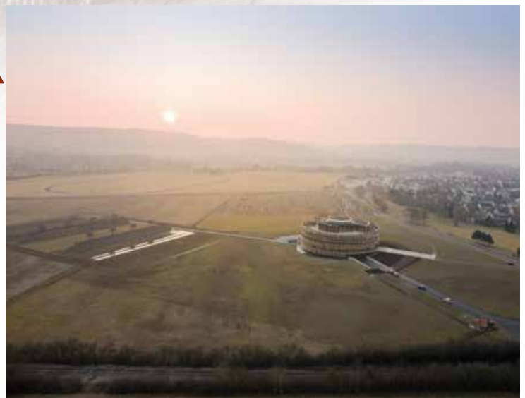
Centre d'interprétation d'Alésia © Iwan Baan

99 Alésia défaite irréversible Le MuséoParc d'Alésia