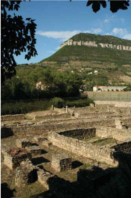
La Graufesenque à Millau